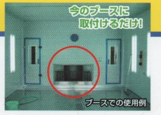
ブースでの使用例